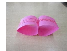
【 くるくる 】