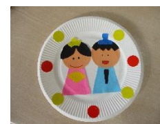
【 おひなさま 】